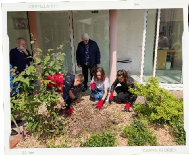
« Réaménagement du patio » de la résidence de l'étoile