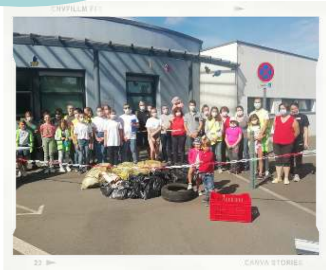
« Nettoyons ensemble Mésanger » le 28 août 2021