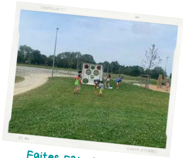
Faites Fête l'été